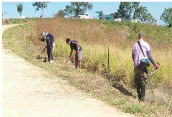
ภาพที่ 2 การปรับปรุงภูมิทัศน์ภายในหมู่บ้านเพื่อต้อนรับนักท่องเที่ยว

2. ทุนทางสังคม พบว่าชาวบ้านมีความร่วมมือและสามัคคีในเรื่องต่างๆ เช่น การปรับปรุงภูมิทัศน์ภายในหมู่บ้านเพื่อต้อนรับนักท่องเที่ยว การช่วยกันปลูกไม้ดอกไม้ประดับสองข้างทางเพื่อให้เกิดความสวยงามของหมู่บ้านในการพัฒนาแหล่งท่องเที่ยวและนอกจากนี้ชาวบ้านยังมีการสร้างกลุ่มวิสาหกิจชุมชนอยู่ 2 กลุ่ม คือ 1) กลุ่มวิสาหกิจชุมชนกาแฟห้วยลาด 2) กลุ่มวิสาหกิจชุมชนท่องเที่ยวเชิงอนุรักษ์ห้วยลาด เป็นการจัดตั้งกลุ่มเพื่อสร้างความสามัคคีภายในชุมชน และสร้างรายได้ให้กับคนในชุมชน