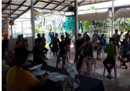
ภาพที่ 1 การประชุมของผู้นำชุมชน คณะกรรมการหมู่บ้าน และสมาชิกในกลุ่มวิสาหกิจชุมชนท่องเที่ยวเชิงอนุรักษ์ห้วยลาด

ท่องเที่ยวเชิงอนุรักษ์ให้เป็นรูปธรรม การประชาสัมพันธ์ การจัดกิจกรรมต่างๆยังไม่สามารถเห็นได้ชัดเจน ซึ่งเป็นปัญหาในการพัฒนาการท่องเที่ยวเชิงอนุรักษ์และการสร้างเศรษฐกิจของชุมชนให้มีความเข้มแข็งและยั่งยืน