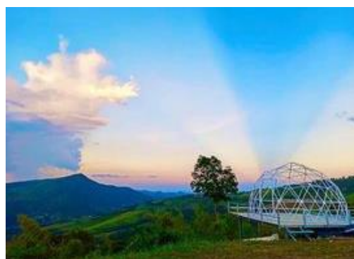
ภาพที่ 5 จุดชมวิวกุคัง

4. ทุนธรรมชาติ พบว่าบ้านห้วยลาดเป็นหมู่บ้านที่เต็มไปด้วยพืชผลทางการเกษตรล้อมรอบหมู่บ้าน โดยเฉพาะต้นอโศกโคโธ ที่มีเกือบทุกหลังคาเรือน ประมาณ 5000 ต้น ป่าไม้ในหมู่บ้านมีความอุดมสมบูรณ์ มีแหล่งน้ำเพียงพอสำหรับการเกษตร และนอกจากนี้ยังมีจุดชมวิวกุคังซึ่งจัดเป็นลานกลางต้นนักท่องเที่ยวสามารถขึ้นไปกางเต็นท์ได้ ในช่วงฤดูหนาว เป็นช่วงที่อากาศค่อนข้างเย็นสบายเหมาะสำหรับการมาพักผ่อน