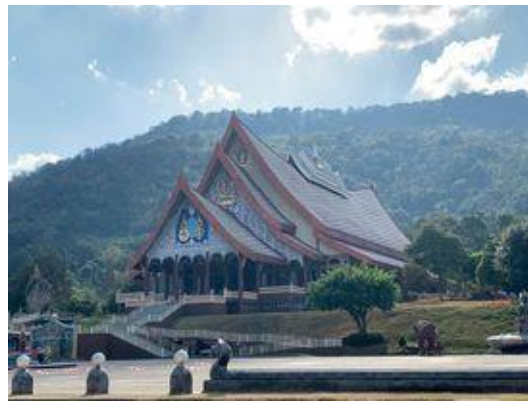
ภาพที่ 4 วัดป่าห้วยลาด

จากภาพที่ 3 แสดงทุนกายภาพของหมู่บ้านห้วยลาด หมู่ที่ 3 ตำบลसानตม อำเภอกุเรือ จังหวัดเลย ประกอบด้วย วัดป่าห้วยลาด เส้นทางไปสวนอโศกโคโธ และจุดชมวิวกุคัง ซึ่งผู้วิจัยได้ทำเครื่องหมาย ดังนี้ วงกลมสีส้ม คือการแสดงที่ตั้งของวัดป่าห้วยลาด ลูกศรสีเขียว คือการชี้ให้เห็นถึงเส้นทางไปยัง สวนอโศกโคโธและจุดชมวิวกุคังซึ่งห่างจากหมู่บ้าน 3 กิโลเมตร